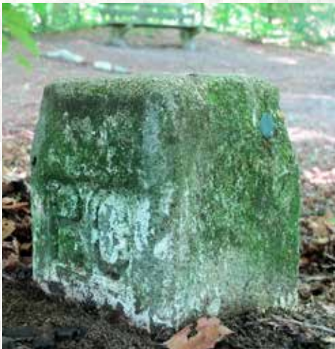
Het RG-paaltje bij het bankje op de Paasberg.

In 1927 werd een nieuw Rijkswegenplan gepubliceerd, waarin de straatweg van Arnhem naar Zutphen als Rijksweg nr. 48 was opgenomen. Nadat in 1993 de autosnelweg A348 van knooppunt Velperbroek naar Dieren gereed kwam werd het beheer van de Velperweg overgedragen aan de gemeente Arnhem en konden de "RG"-paaltjes langs die weg verwijderd worden. Maar dat is dus niet overal gebeurd.