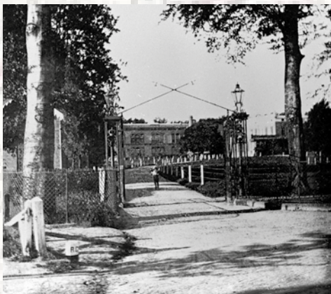
Een RG-paaltje voor de ingang van Bronbeek, ca. 1890-1900.